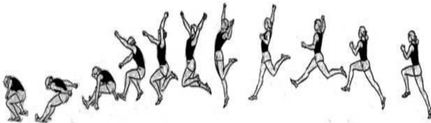
СХЕМА ПРЫЖКА В ДЛИНУ СПОСОБОМ «ПРОГНУВШИСЬ»