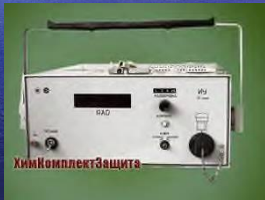
Индивидуальный прибор для измерения поглощённой дозы