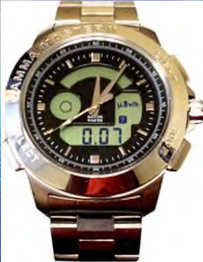
Часы, измеряющие эквивалентную дозу