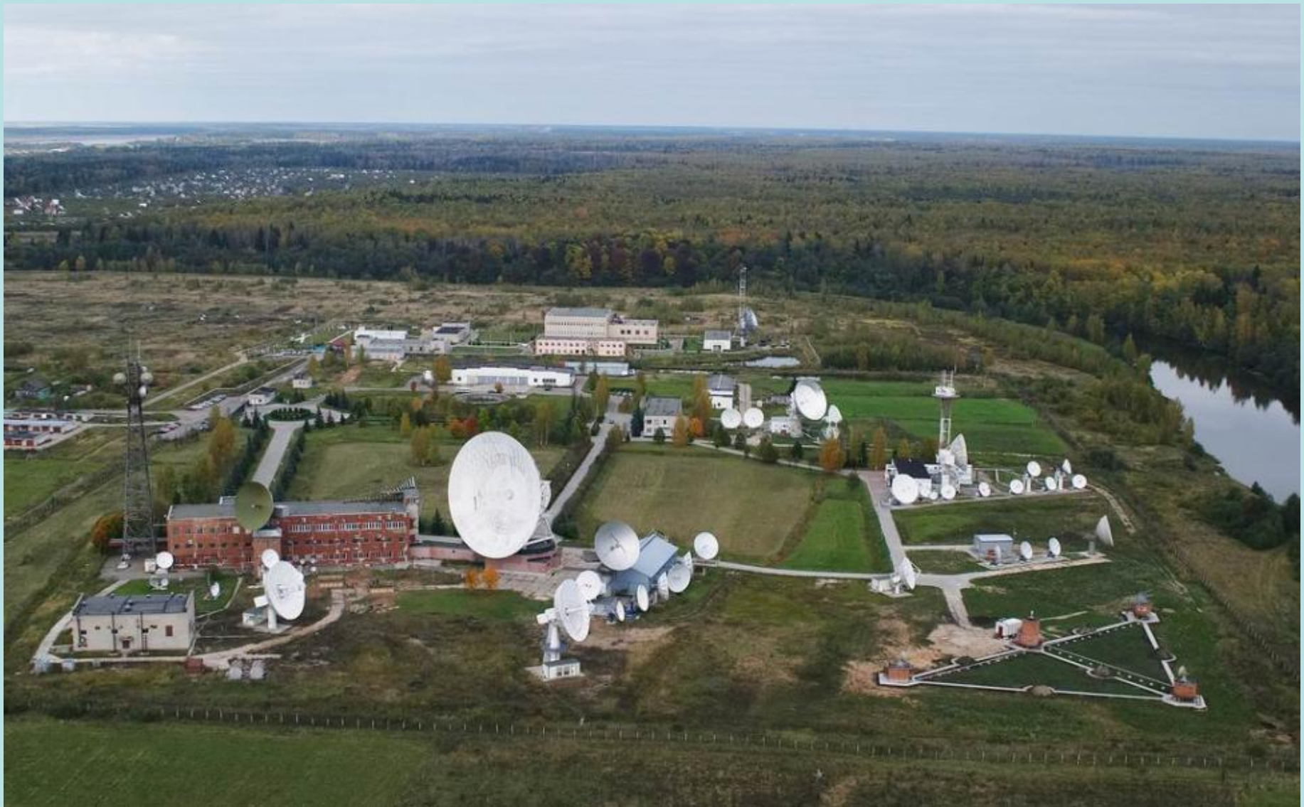
Бавкун Т.Н. МБОУ ОСОШ №3 г.Очер