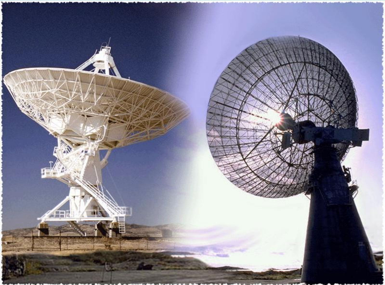
Бавкун Т.Н. МБОУ ОСОШ №3 г.Очер