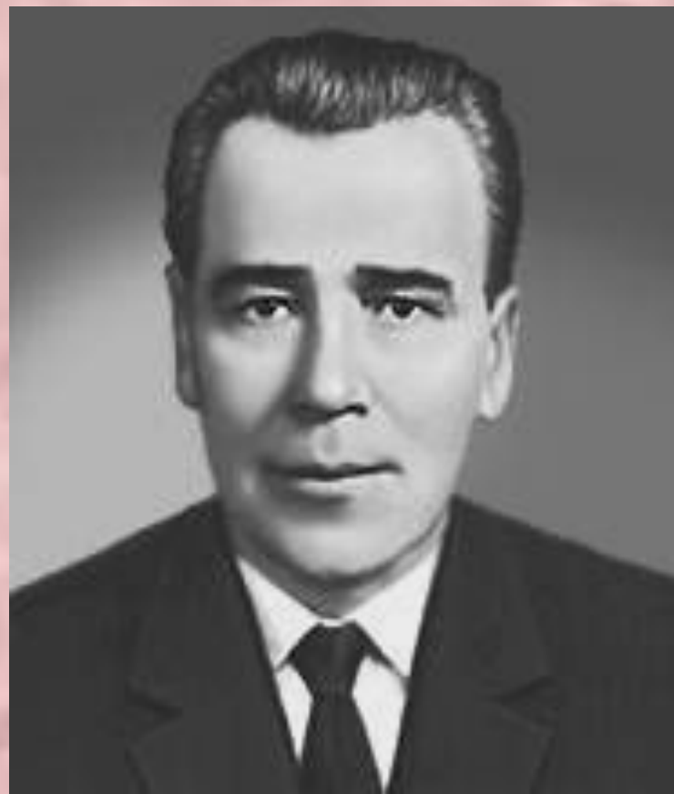
М. К. Янгель.