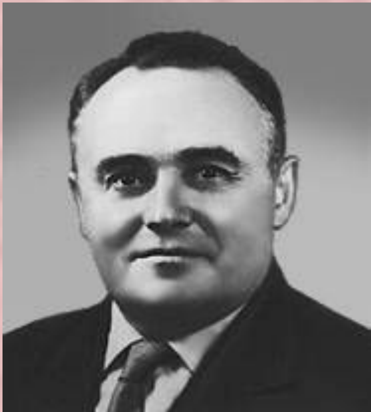
С. П. Королев.