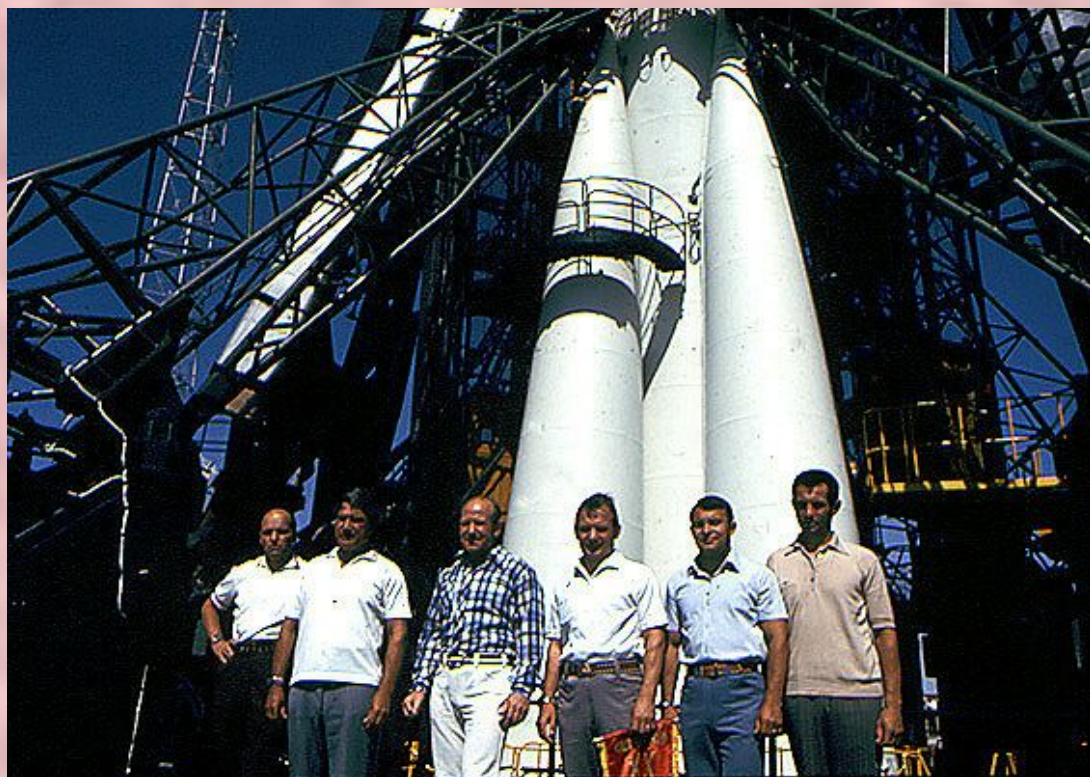
На снимке (справа налево): космонавты А. С. Иванченков, Ю. В. Романенко, В. Н. Кубасов, А. А. Леонов, А. В. Филипченко и Н. Н. Рукавишников у подножия ракеты-носителя с космическим кораблем «Союз-19» на космодроме Байконур.