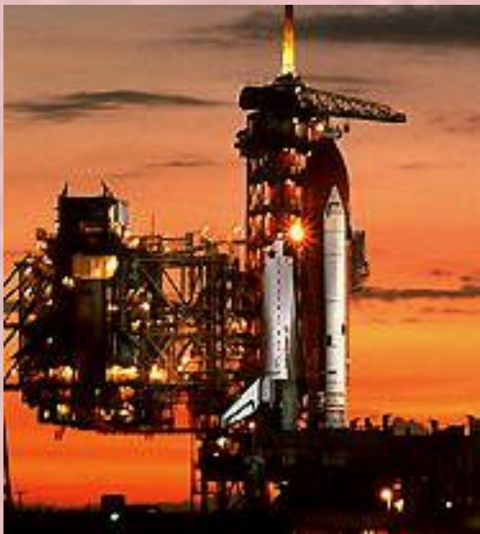
Старт космического корабля