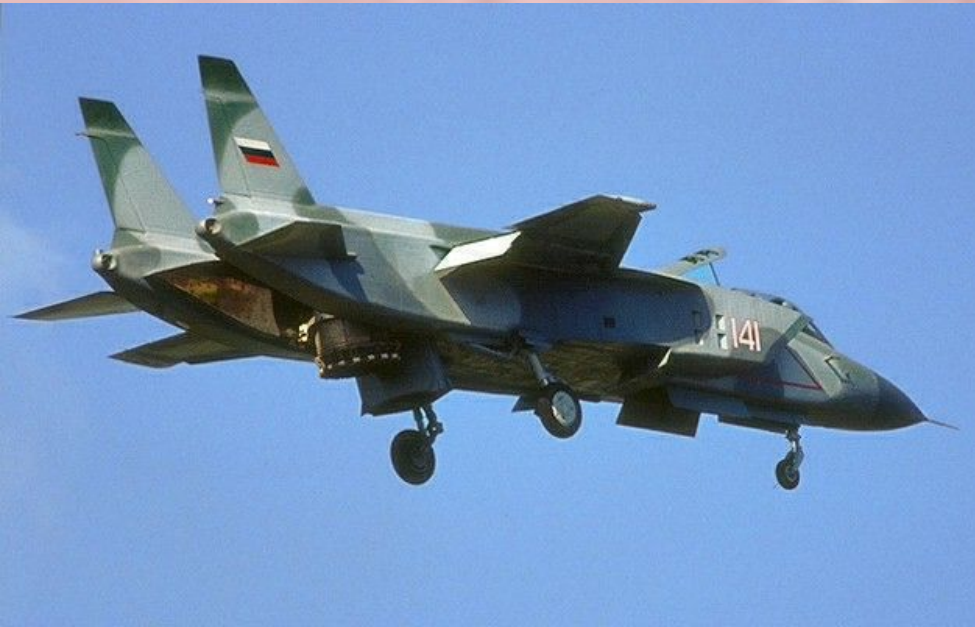
Як - 141

Эта машина первой среди самолетов своего класса преодолела скорость звука. На новом истребителе-бомбардировщике установлено 12 мировых рекордов. Як-141 предназначен для перехвата воздушных целей, ведения ближнего боя, нанесения штурмовых ударов по наземным и надводным целям. Он может эксплуатироваться на взлетно-посадочных площадках ограниченного размера и кораблях. Як-141 пока в серию не запущен, хотя такие страны, как Италия, Индия, Аргентина, изъявили желание приобрести этот самолет для своих ВВС.