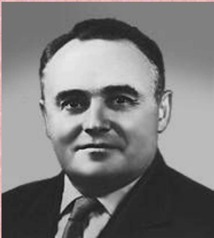
С. П. Королев.