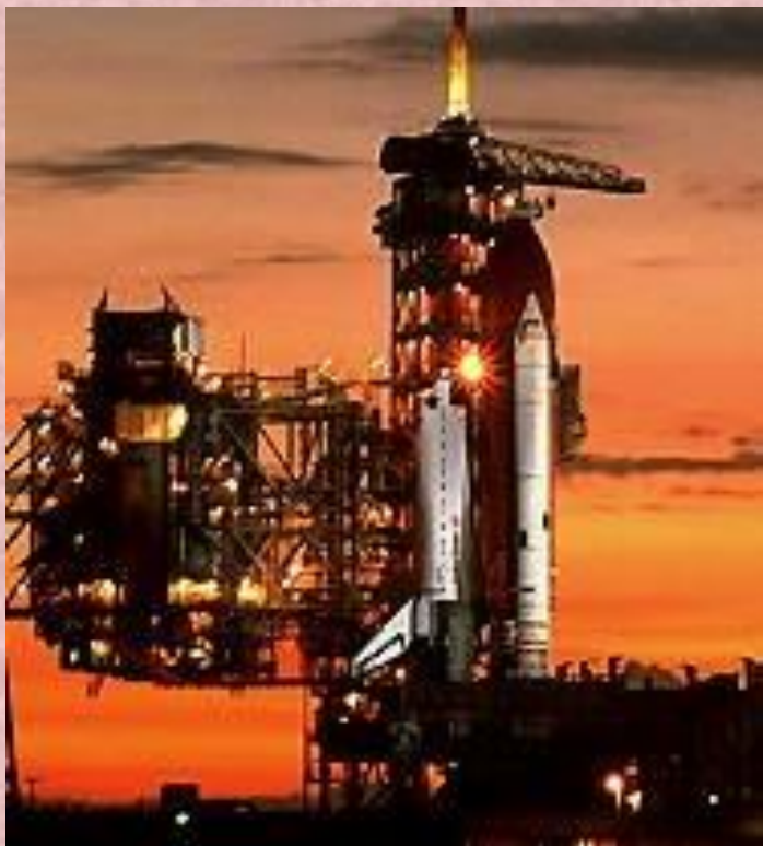
Старт космического корабля