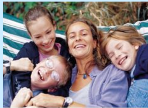
Нормальная влажность воздуха 60 %