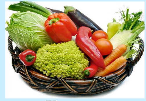
Хранение овощей, фруктов и др.