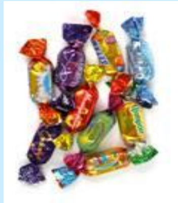
Производство тканей, конфет, табака и др.