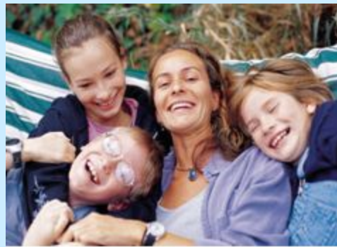
Нормальная влажность воздуха 60 %