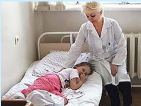
Больницы, поликлиники, аптеки