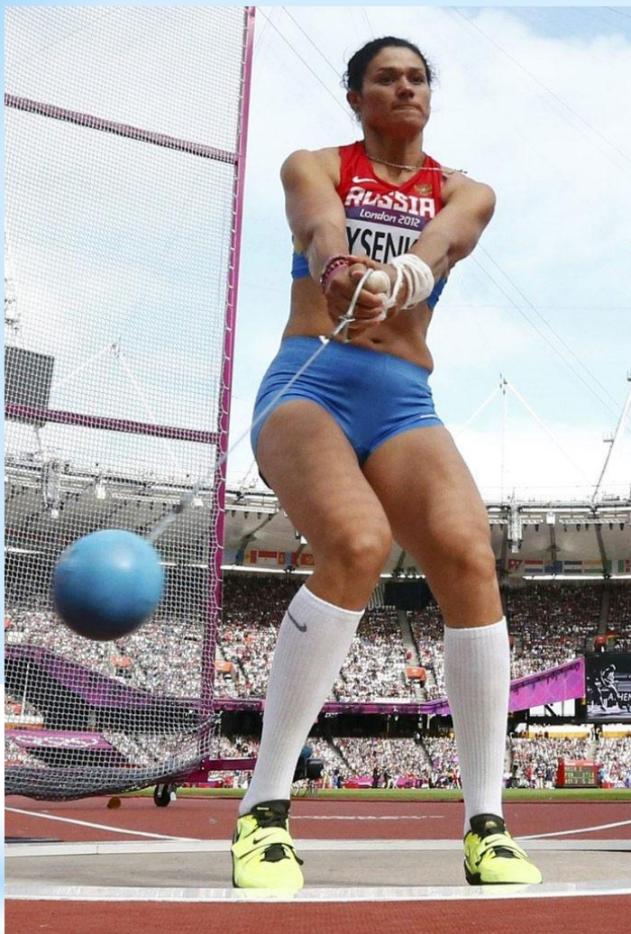
*Татьяна Лысенко - метание молота