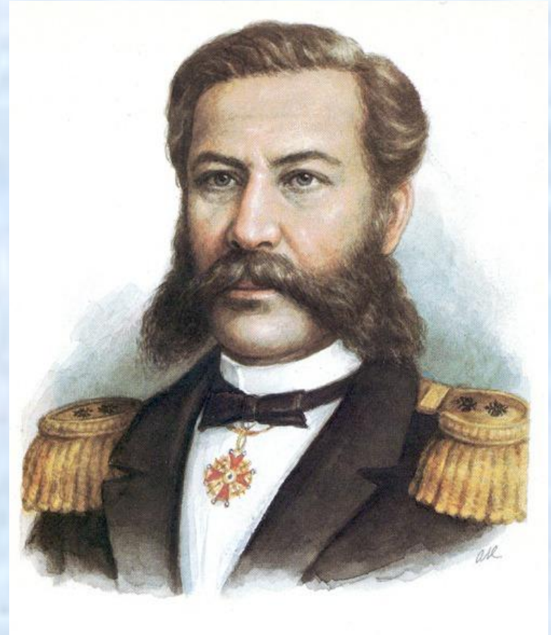
А.Ф. МОЖАЙСКИЙ - ИЗОБРЕТАТЕЛЬ ПЕРВОГО В МИРЕ САМОЛЕТА

Сегодня мы поговорим о тех, кто стоял у самых истоков российской науки и техники, о талантливых мастерах, изобретателях, инженерах, ученых.