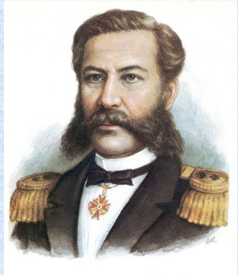
А.Ф. МОЖАЙСКИЙ - ИЗОБРЕТАТЕЛЬ ПЕРВОГО В МИРЕ САМОЛЕТА

Сегодня мы поговорим о тех, кто стоял у самых истоков российской науки и техники, о талантливых мастерах,