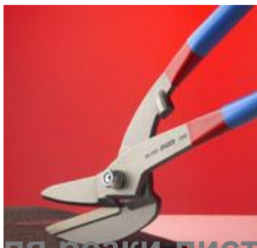
для резки листового металла