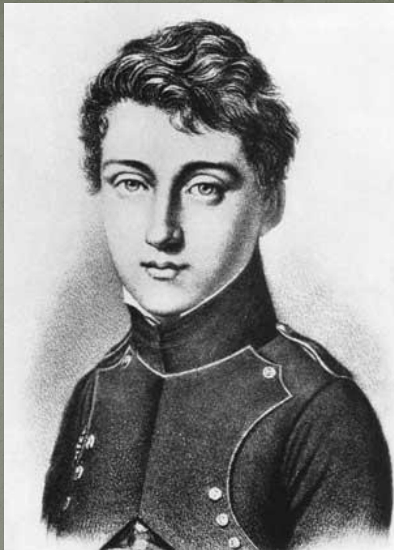
Никола Леонар Сади Карно ( Nicolas Léonard Sadi Carnot, 1796-1832 )