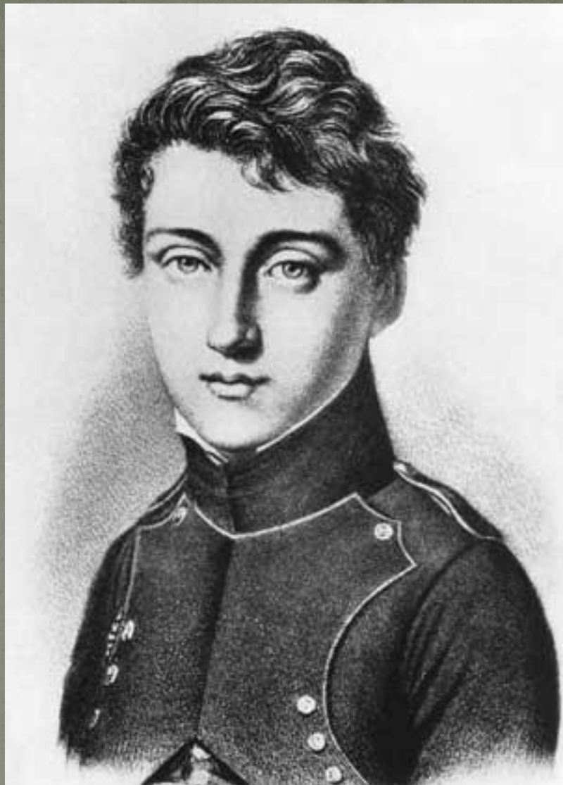
Никола Леонар Сади Карно ( Nicolas Léonard Sadi Carnot, 1796-1832 )