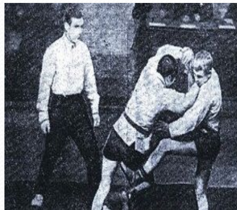
Турнир по самбо в Риге 1967г.

В 1966 году на конгрессе Международной федерации любительской борьбы (ФИЛА) самбо официально признается международным видом спорта . Начался уверенный рост популярности самбо по всему миру. Уже на следующий год в Риге состоялся первый международный турнир по самбо, в котором приняли участие спортсмены Югославии, Японии, Монголии, Болгарии и СССР. В 1972 году проходит первый открытый чемпионат Европы, а в 1973 году — первый чемпионат мира, в котором приняли участие спортсмены из 11 стран. В последующие годы регулярно проводятся чемпионаты Европы, мира, международные турниры. Создаются федерации самбо в Испании, Греции, Израиле, США, Канаде, Франции и других странах. В 1977 году самбисты впервые выступают на Панамериканских играх; в этом же году впервые разыгрывается Кубок мира по самбо. В 1979 году проводится первый чемпионат мира среди молодёжи, а через два года — первый чемпионат мира среди женщин. Также в 1981 году самбо вошло в Боливарианские игры Южной Америки.