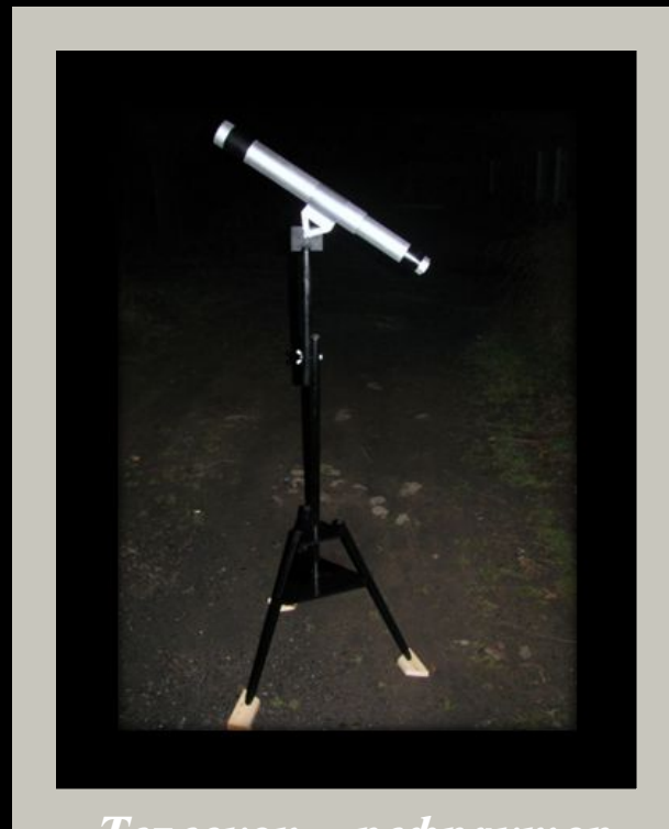
Телескоп – рефрактор в собранном виде