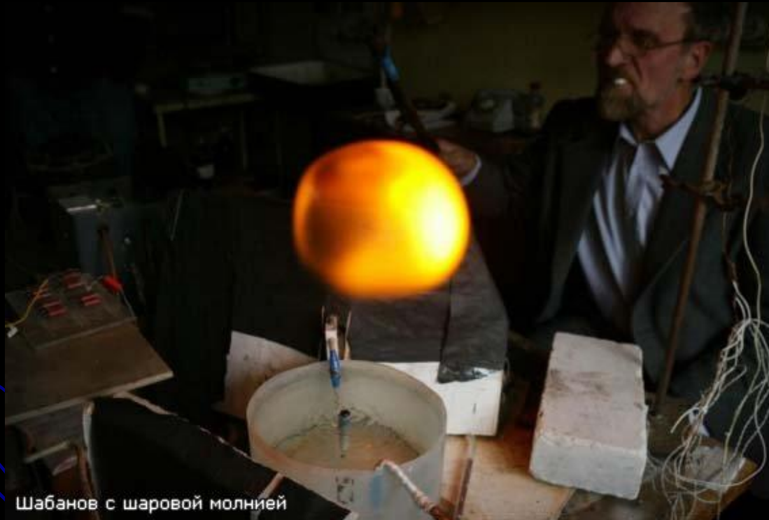
Шабанов с шаровой молнией