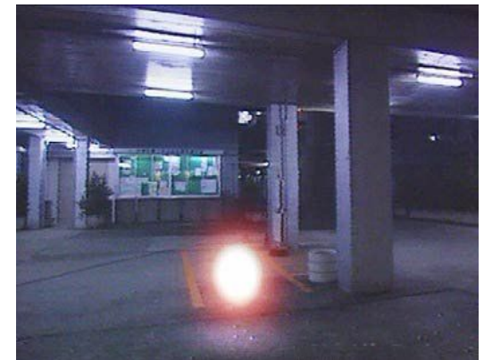
Единственный существующий сейчас «шаромолниеотвод»

Если же шаровая молния задела кого-то и человек потерял сознание, то его необходимо перенести в хорошо проветриваемое помещение, тепло укутать, сделать искусственное дыхание и обязательно вызвать скорую помощь. Вообще же, технические средств защиты от шаровых молний как таковых пока не разработано.