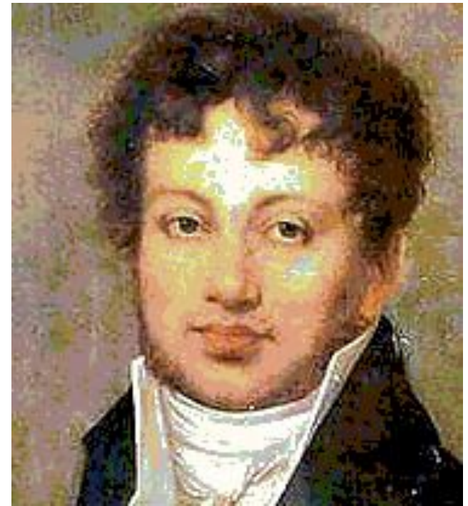
Ампер Андре Мари 1775 – 1836

французский физик, математик, химик, член Парижской АН (1814), иностраннный член Петербургской АН (1830), один из основоположников электродинамики.