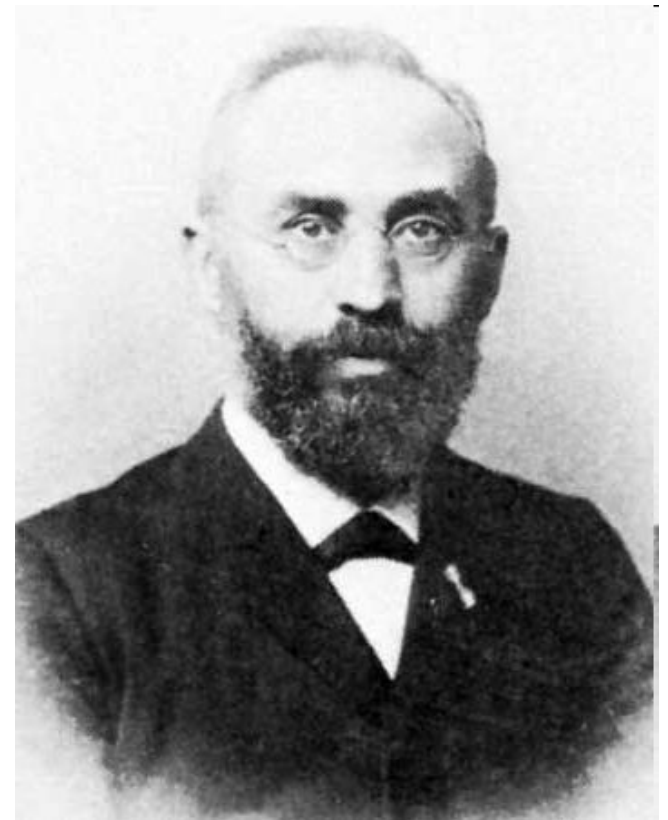
Лоренц Хендрик Антон

нидерландский физик – теоретик, создатель классической электронной теории