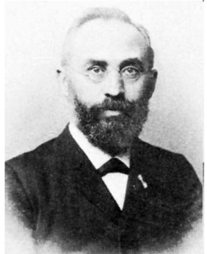
Лоренц Хендрик Антон

нидерландский физик – теоретик, создатель классической электронной теории