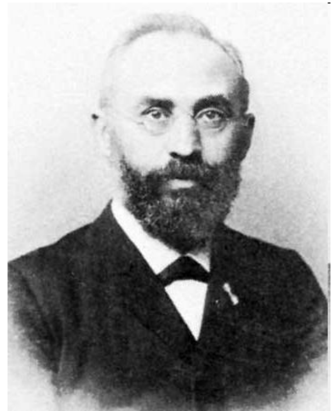
Лоренц Хендрик Антон

нидерландский физик – теоретик, создатель классической электронной теории