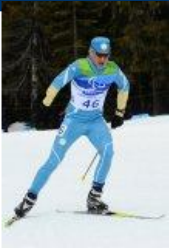
Украинский спортсмен, призёр Паралимпийских игр в Ванкувере.