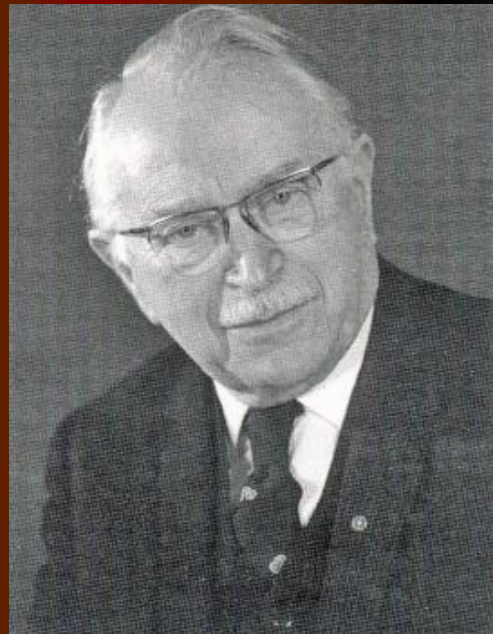
Людвиг Гуттман - отец Паралимпийских игр

Возникновение видов спорта, в которых могут участвовать инвалиды, связывают с именем английского нейрохирурга Людвиг Гуттмана, который, преодолевая вековые стереотипы по отношению к людям с физическими недостатками, ввел спорт в процесс реабилитации больных с повреждениями спинного мозга. Он на практике доказал, что спорт для людей с физическими недостатками создает условия для успешной жизнедеятельности, восстанавливает психическое равновесие, позволяет вернуться к полноценной жизни независимо от физических недостатков.