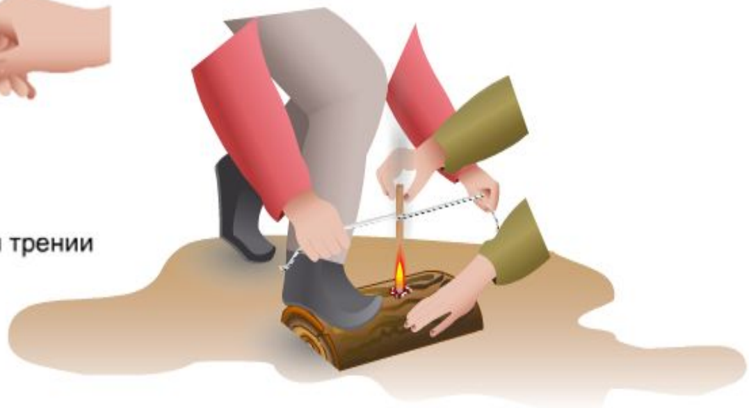
Использование явления увеличения внутренней энергии при разжигании костра