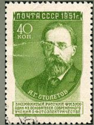
Почтовая марка СССР, 1951 год