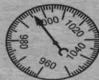
Рис. 18. Шкала барометра 2