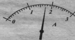
Рис. 21. Шкала амперметра 4