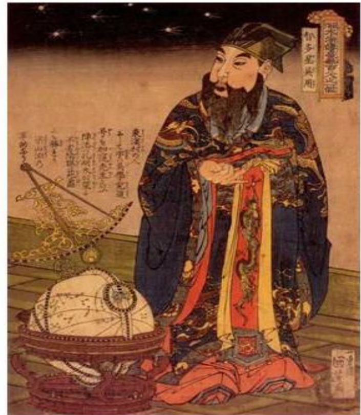
Китайский астроном, 1675 год