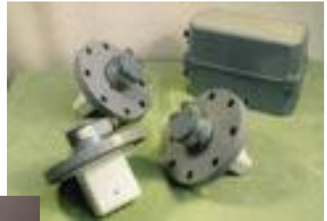
Турбінний лічильник тепла