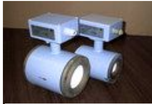
Ультразвуковий лічильник тепла