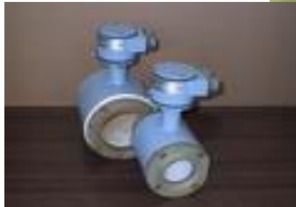
Електромагнітний лічильник тепла