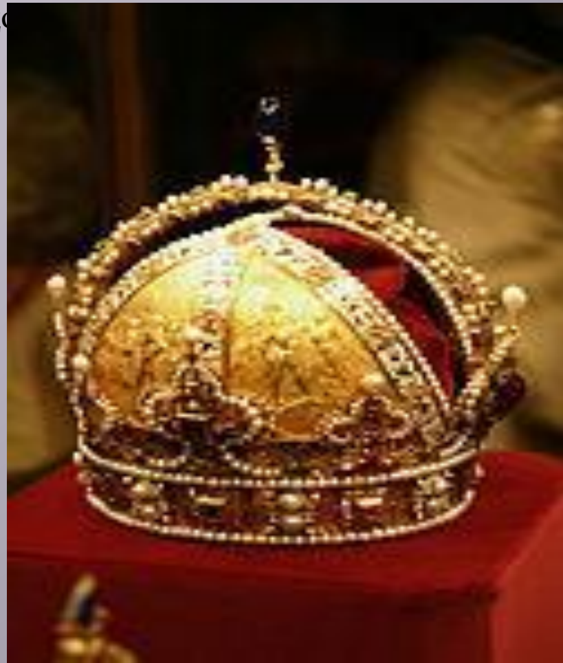
Корона Рудольфа II

В 1604 г. вспыхнуло восстание протестантов в Венгрии. Однако Рудольфа угроза распространения мятежа по всей стране совершенно не волновала. В 1606 г. Габсбурги на семейном совете постановили считать Рудольфа душевнобольным и передали власть в Австрии и Венгрии его брату Матвею . Тот поспешно признал за венгерским дворянами и городами право на свободу вероисповедания. Император отказался признавать это постановления, но Матвей двинул войска на Прагу. У Рудольфа не было сил для отражения агрессии, и он был вынужден подчиниться. Австрия, Венгрия и Моравия были официально переданы Матвею, а в Чехии он был провозглашен наследником Рудольфа.