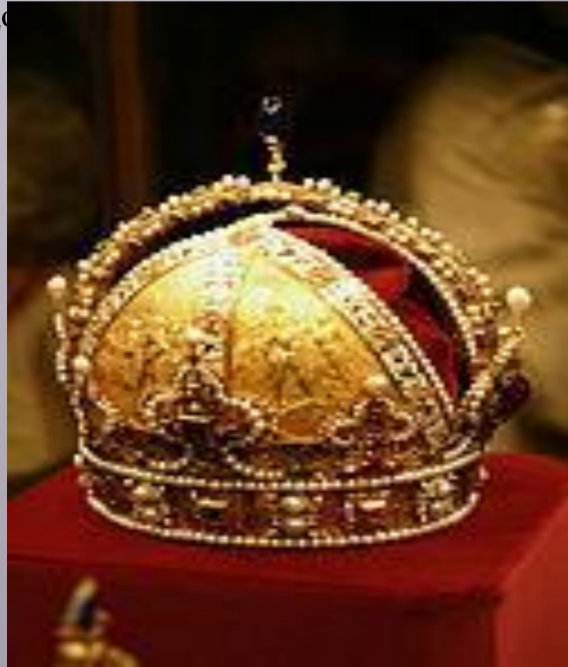
Корона Рудольфа II

В 1604 г. вспыхнуло восстание протестантов в Венгрии. Однако Рудольфа угроза распространения мятежа по всей стране совершенно не волновала. В 1606 г. Габсбурги на семейном совете постановили считать Рудольфа душевнобольным и передали власть в Австрии и Венгрии его брату Матвею . Тот поспешно признал за венгерским дворянами и городами право на свободу вероисповедания. Император отказался признавать это постановления, но Матвей двинул войска на Прагу. У Рудольфа не было сил для отражения агрессии, и он был вынужден подчиниться. Австрия, Венгрия и Моравия были официально переданы Матвею, а в Чехии он был провозглашен наследником Рудольфа.