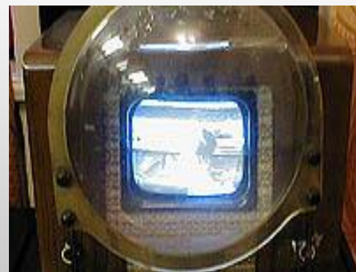
Первый телевизор КВН – 49