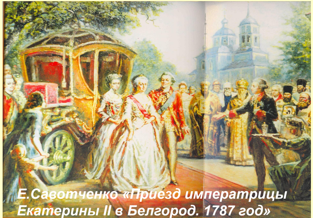
Е. Савотченко «Приезд императрицы Екатерины II в Белгород. 1787 год»