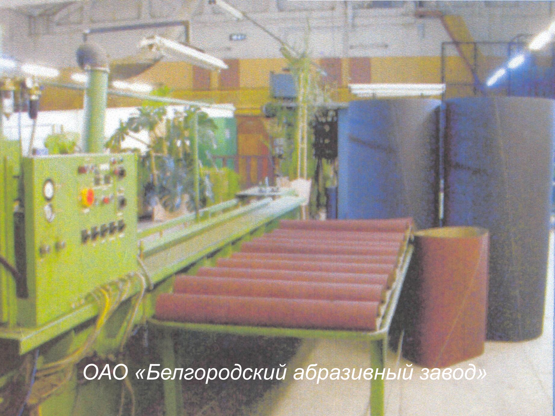
ОАО «Белгородский абразивный завод»