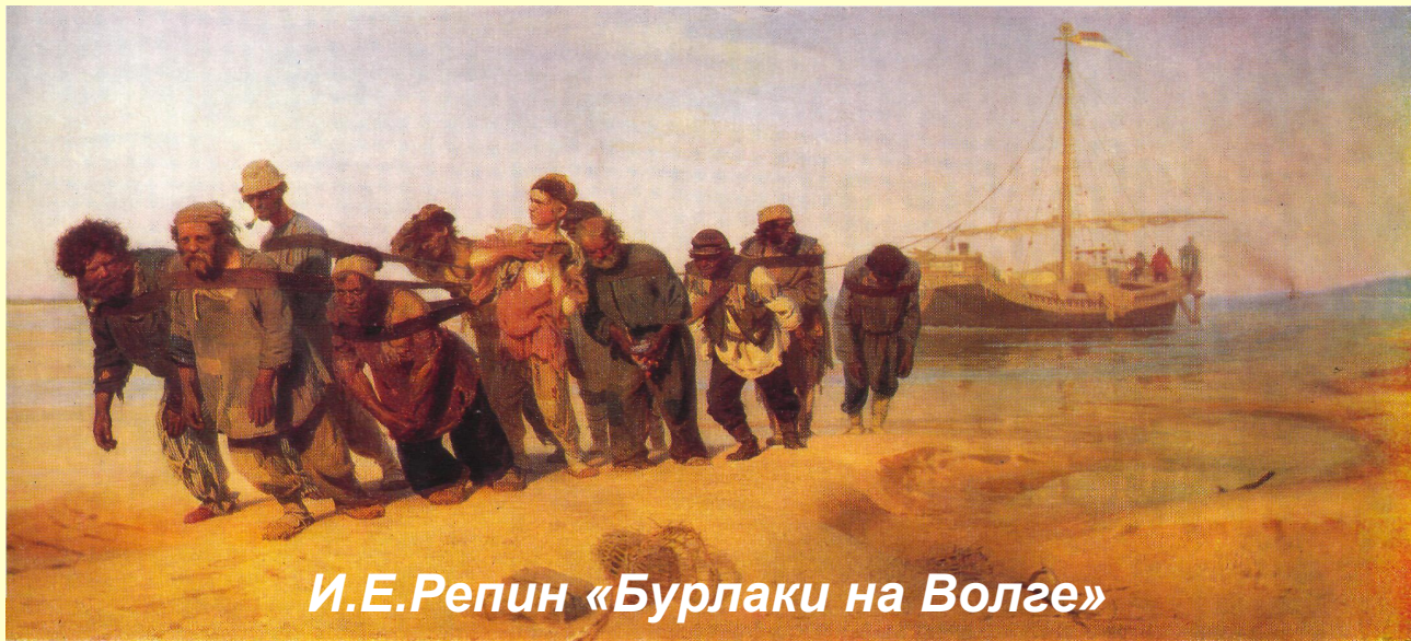
И. Е. Репин «Бурлаки на Волге»