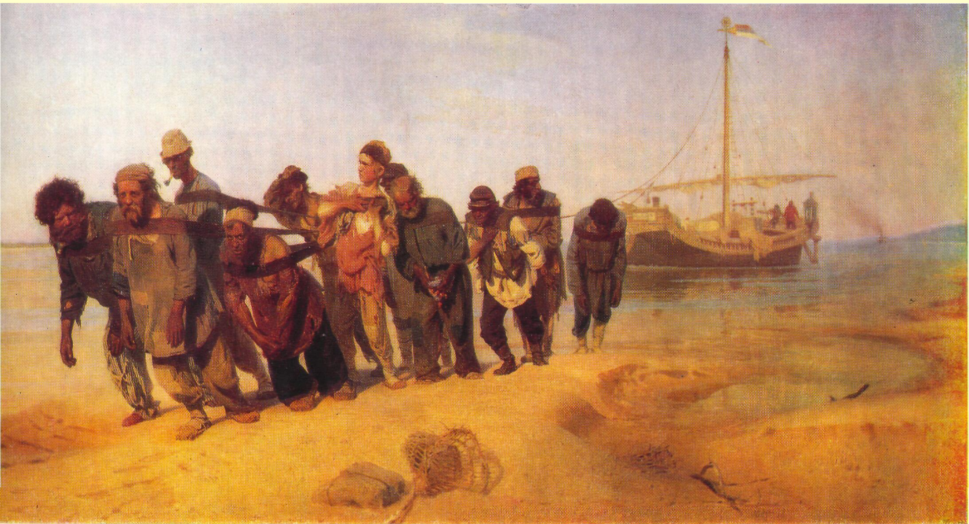
И.Е.Репин «Бурлаки на Волге»