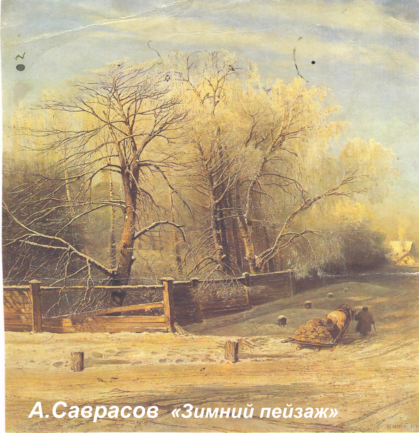
А.Саврасов «Зимний пейзаж»