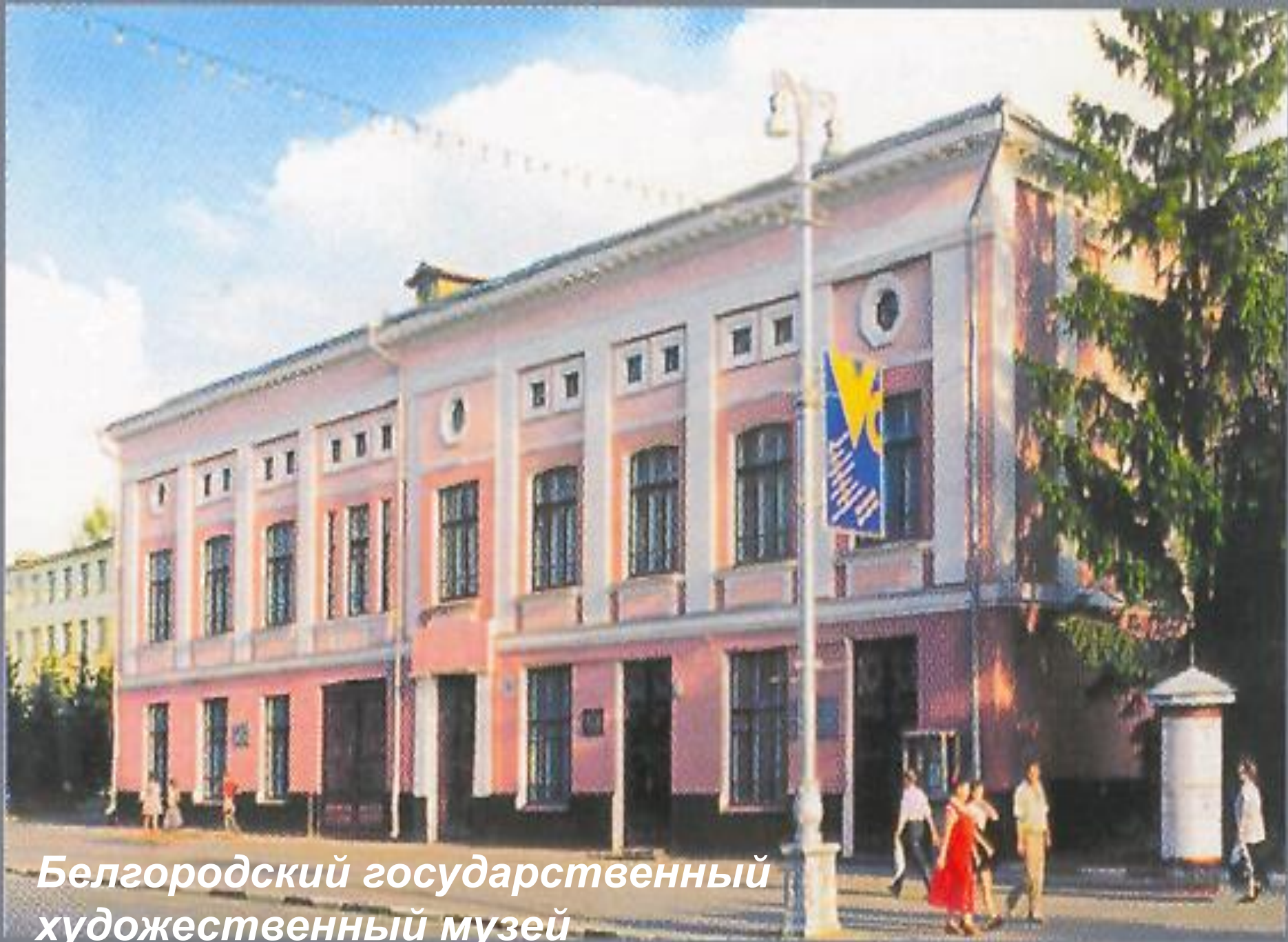
Белгородский государственный художественный музей