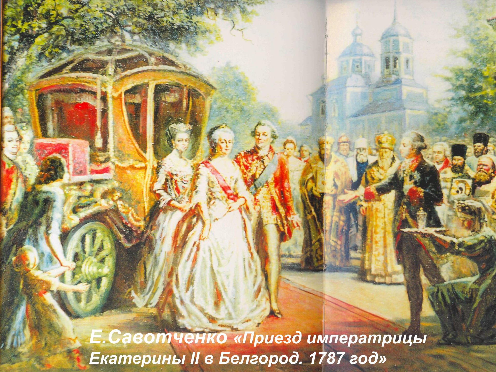
Е. Савотченко «Приезд императрицы Екатерины II в Белгород. 1787 год»