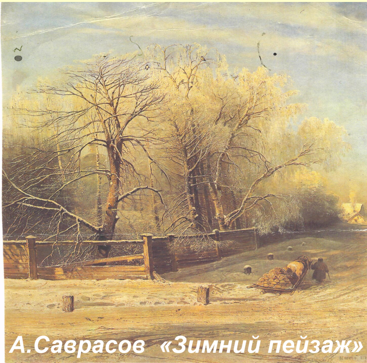
А. Саврасов «Зимний пейзаж»