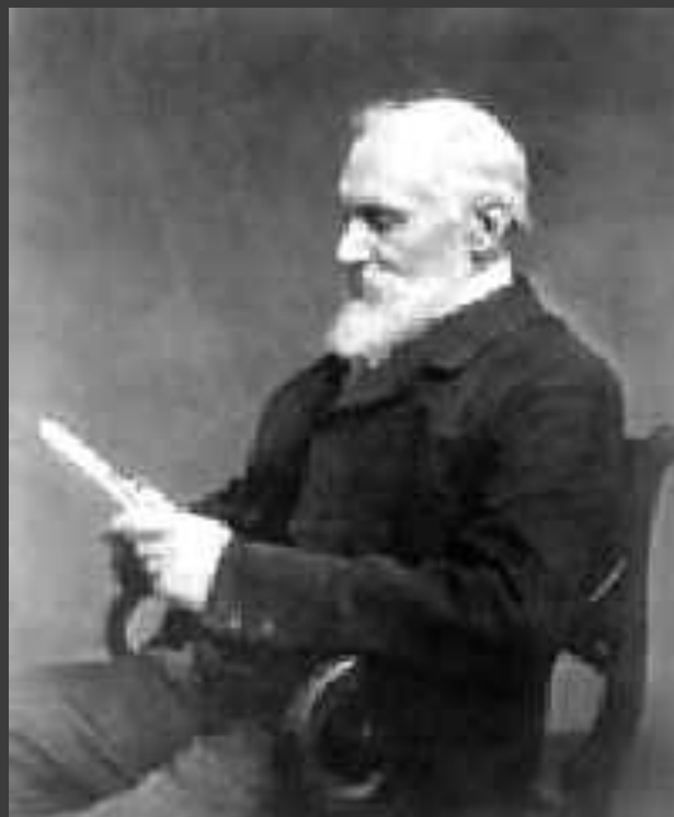
Лорд кельвин в конце жизни

Лорд Кельвин умер 17 декабря 1907 г. и по достоинству покоится в Вестминстерском аббатстве рядом с сэром Исааком Ньютоном.