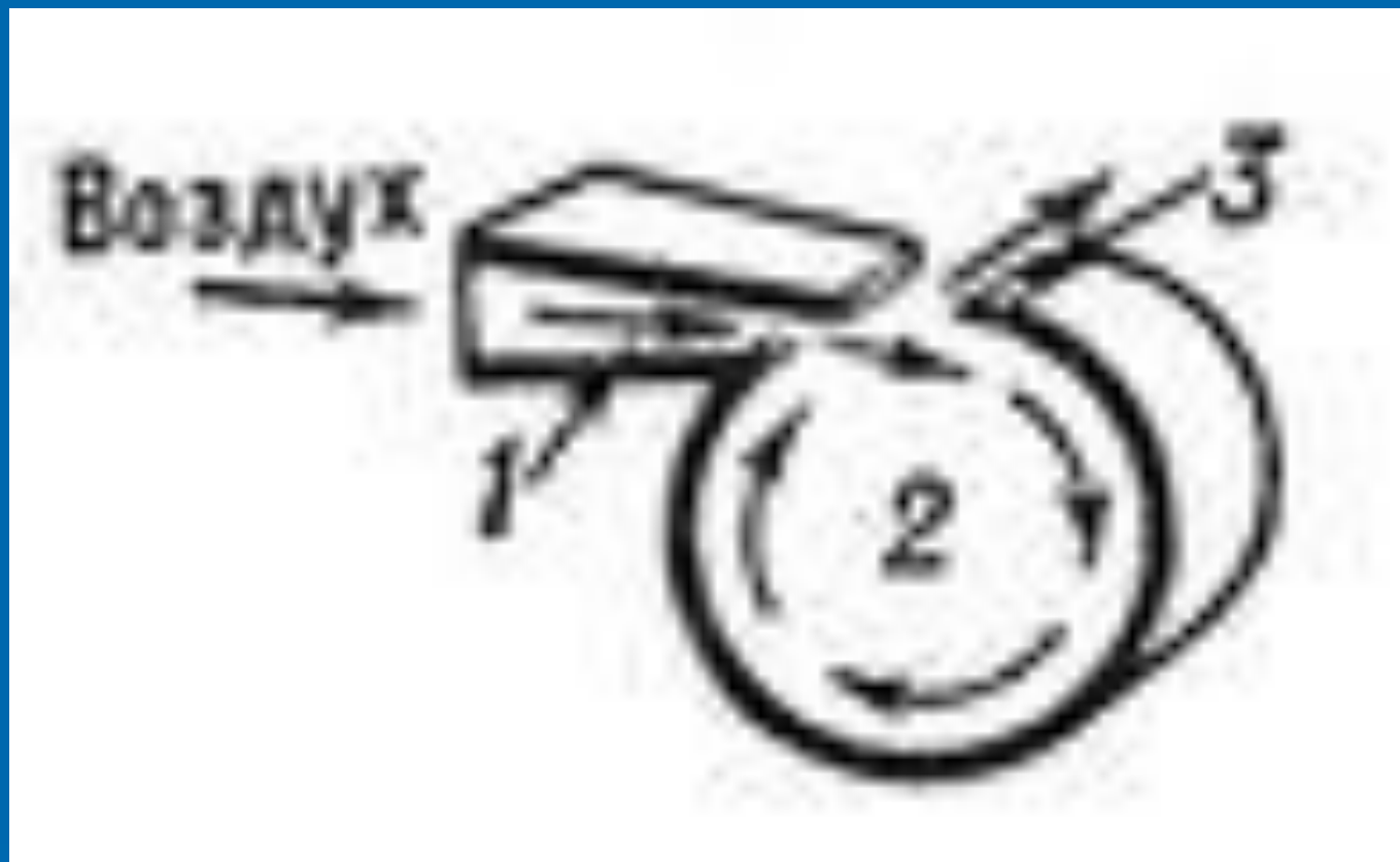
Схема губного свистка: 1 — сопло; 2 — резонансная камера; 3 — острый край резонатора.