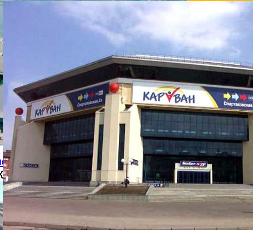
Баскетбольное спортивное сооружение «Баскет-Супер» Адрес: РФ, РТ 420111, г. Казань, Спартаковская, 1