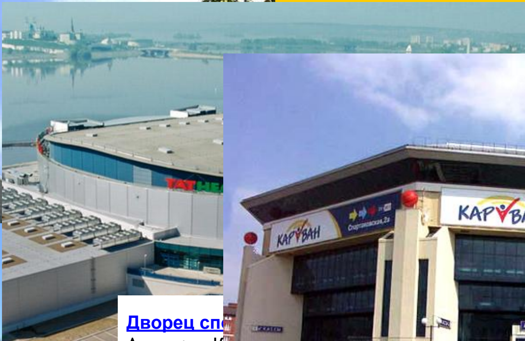
Дворец спорта Адрес: г. Казань