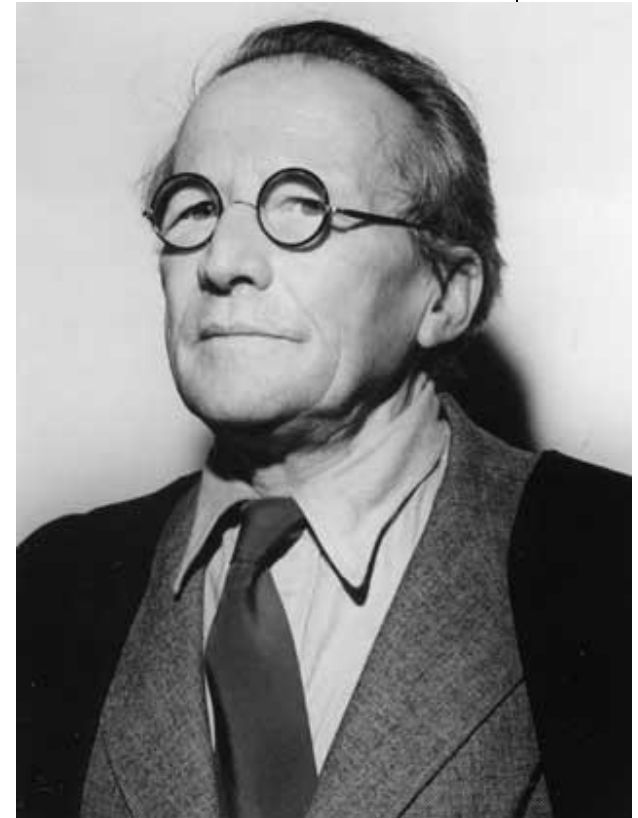
ШРЁДИНГЕР, ЭРВИН австрийский физик. Нобелевская премия по физике 1933 ( с П.Дираком).

\Psi(x, y, z, t) — волновая функция частицы.