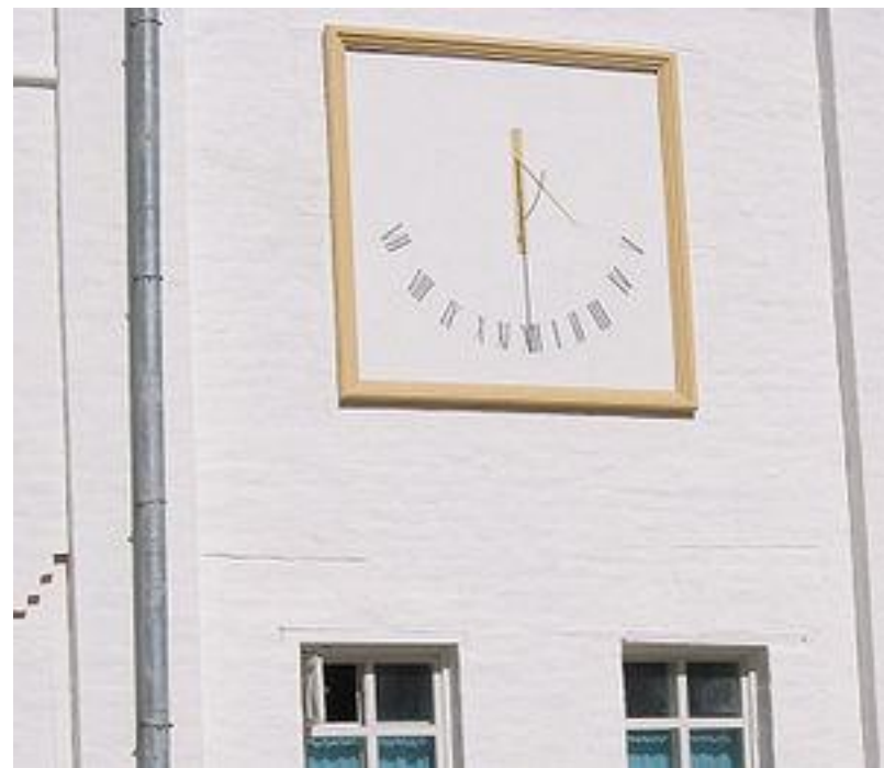
Настенные солнечные часы в Соловецком монастыре

Такие часы много веков украшают стены домов, церквей, общественных зданий. Во многих городах мира сохранились они, как прекрасные архитектурные украшения.