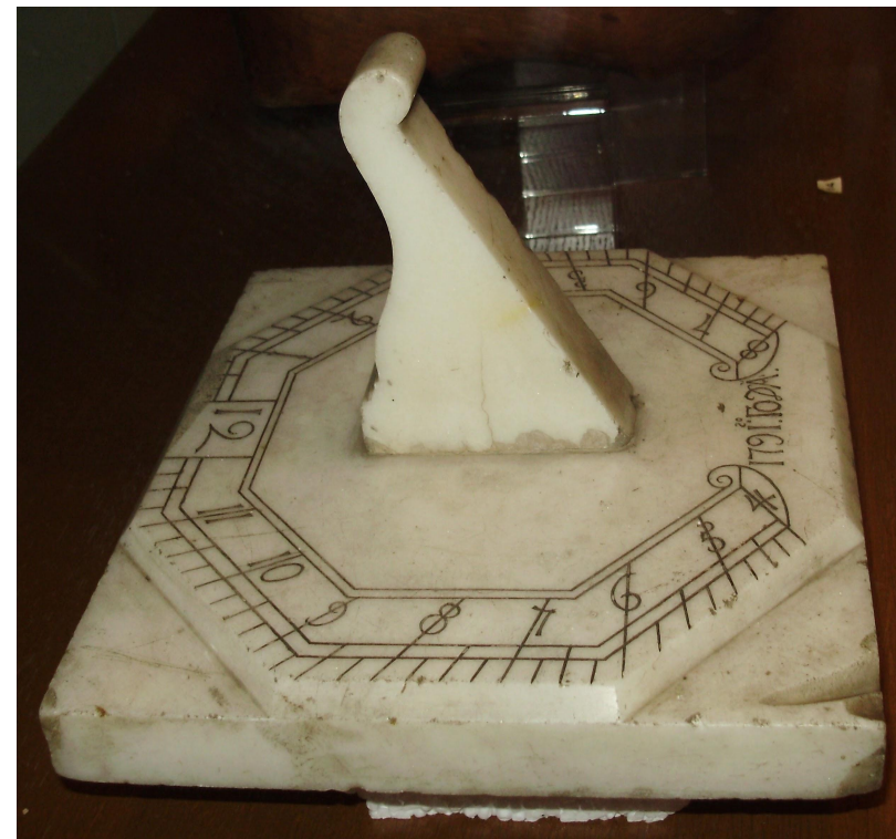
Парковые горизонтальные солнечные часы, изготовленные из мрамора в 1791 году