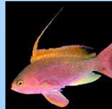
Рыба, обитающая на большой глубине