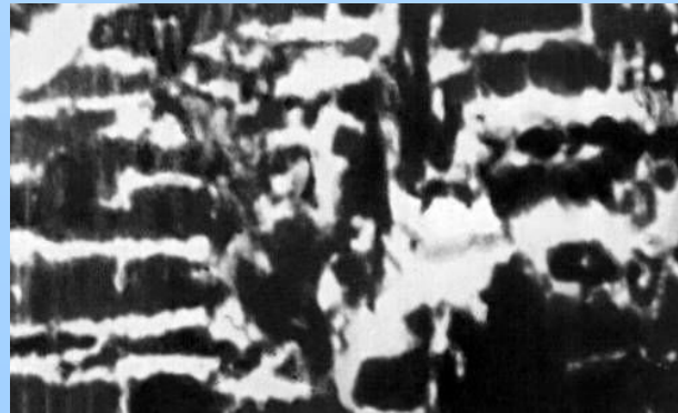
Кусок дерева, пронизанный светящейся грибницей