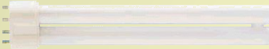
Лампа дневного света

Под действием падающего излучения, атомы вещества возбуждаются и после этого тела высвечиваются.