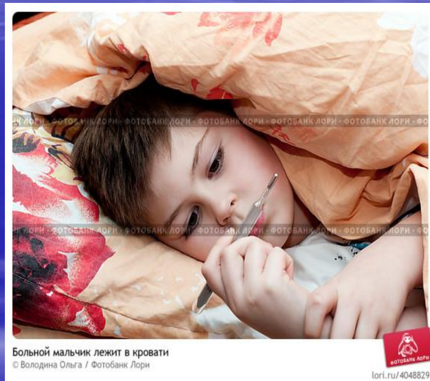
Больной мальчик лежит в кровати