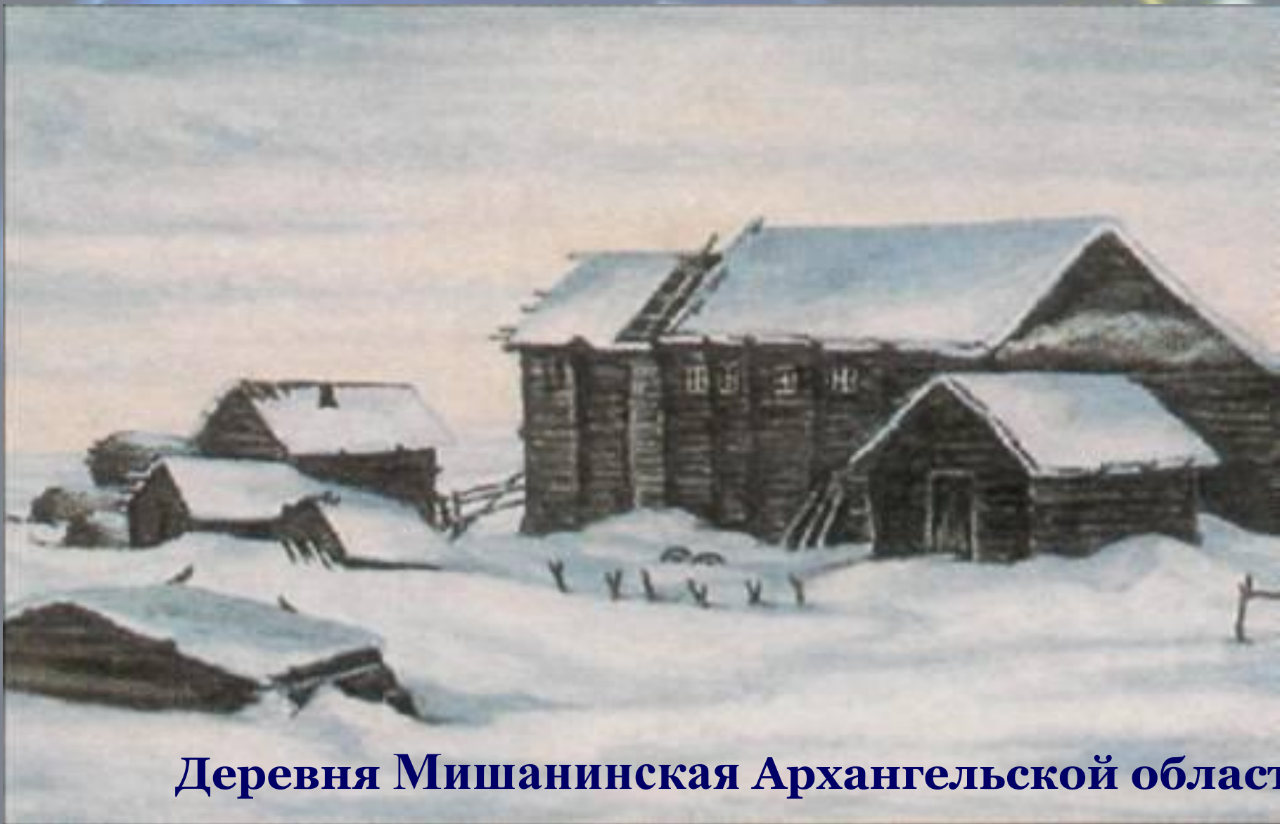
Деревня Мишанинская Архангельской области