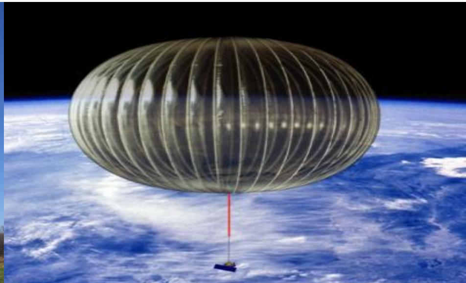
Шар - Зонд