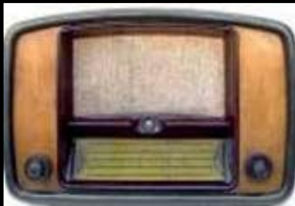
Цьому радіоприймачу понад 60 років

Радіомовлення, як ми його тепер розуміємо, існує вже біля 100 років. Таким чином, інопланетні цивілізації, які здатні прийняти радіопередачі земних радіостанцій, повинні знаходитися від нас на відстані, не більшій, ніж 100 світлових років. Ті, що мешкають далі - навіть не підозрюють про наше існування! Це не так вже й далеко, саме на такій відстані потужні телескопи можуть встановити наявність у зорі планет.