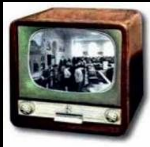
Цьому телевізору - 50 років