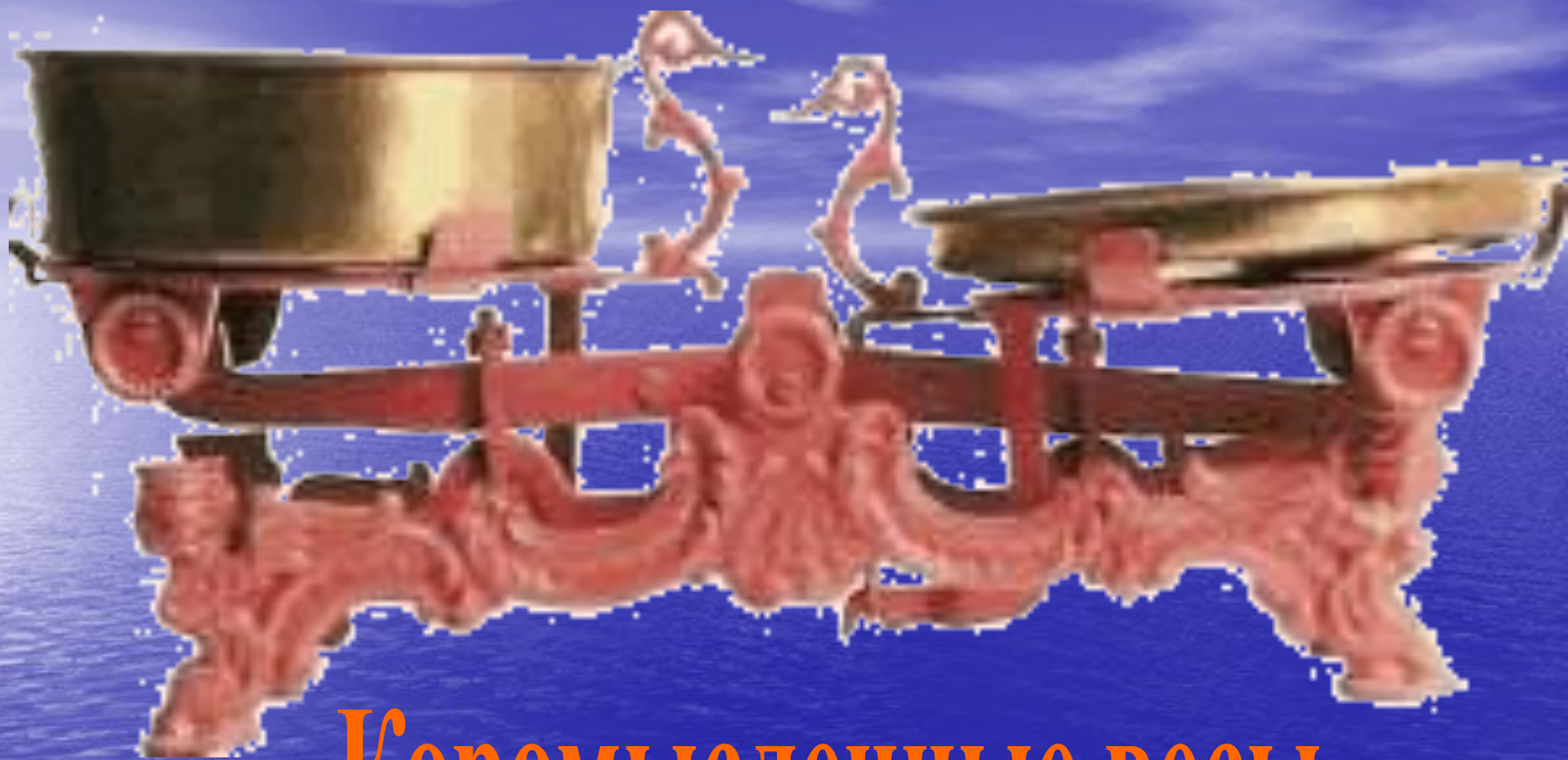
Коромысленные весы (Франция - 1669г.)