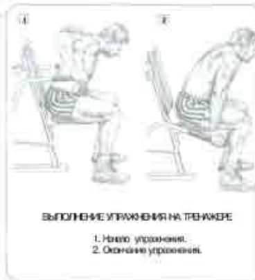
ВЫПОЛНЕНИЕ УПРАЖНЕНИЯ НА БЕНЧЕ

С этой целью следует использовать тренажеры, позволяющие отработать соответствующую технику. Выполнение упражнения 10-20 раз дает оптимальный результат. Для увеличения объема и силы мышц опытные спортсмены подвешивают к специальному поясу закрепленные гантели или диски от штанги.