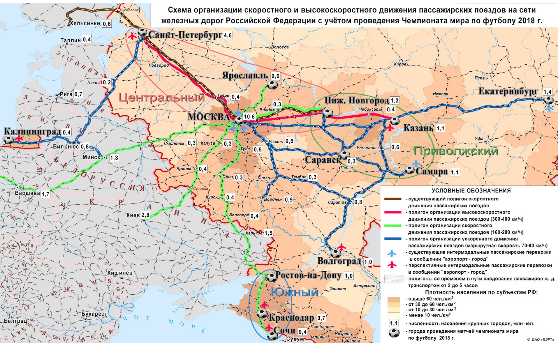
Схема организации скоростного и высокоскоростного движения пассажирских поездов на сети железных дорог Российской Федерации с учётом проведения Чемпионата мира по футболу 2018 г.