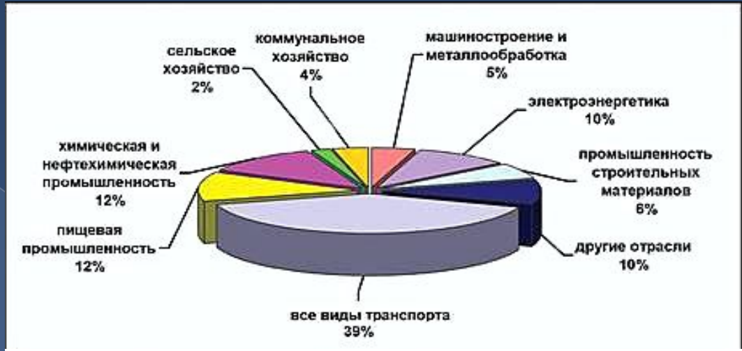
Выбросы загрязняющих веществ в атмосферный воздух в 2011–2014 годах, тысяч тонн

Интенсивное развитие автомобилизации во всем мире после второй мировой войны способствовало значительному по своим последствиям загрязнению воздуха отработавшими газами, особенно опасному в городских и промышленных центрах, а также на территориях прохождения путей сообщения. В настоящее время автомобильный транспорт оказывает значительное влияние на формирование санитарных условий крупных городов и населенных пунктов. Опасность воздействия отработавших газов автомобилей увеличивается вследствие того, что вредные компоненты этих газов выбрасываются непосредственно в атмосферу, окружающую людей, на заселенных территориях, где естественный обмен воздуха ограничен вследствие плотной застройки.