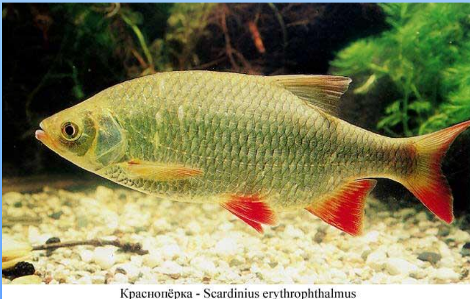
Краснопёрка - Scardinius erythrophthalmus

Установлено, что слабые электрические поля есть у таких рыб, как речной окунь, щука, пескарь, вьюн, карась, красноперка, горбыль и др.