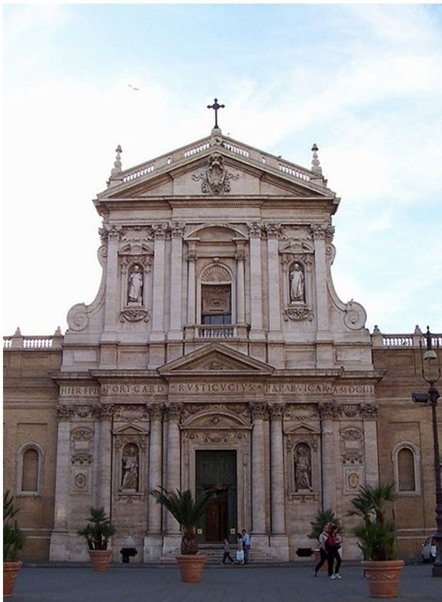
Карло Мадерна Церковь Святой

Для архитектуры барокко - характерны пространственный размах, слитность, текучесть сложных, обычно криволинейных форм. Часто встречаются развернутые масштабные колоннады, изобилие скульптуры на фасадах и в интерьерах. Купола приобретают сложные формы, часто они