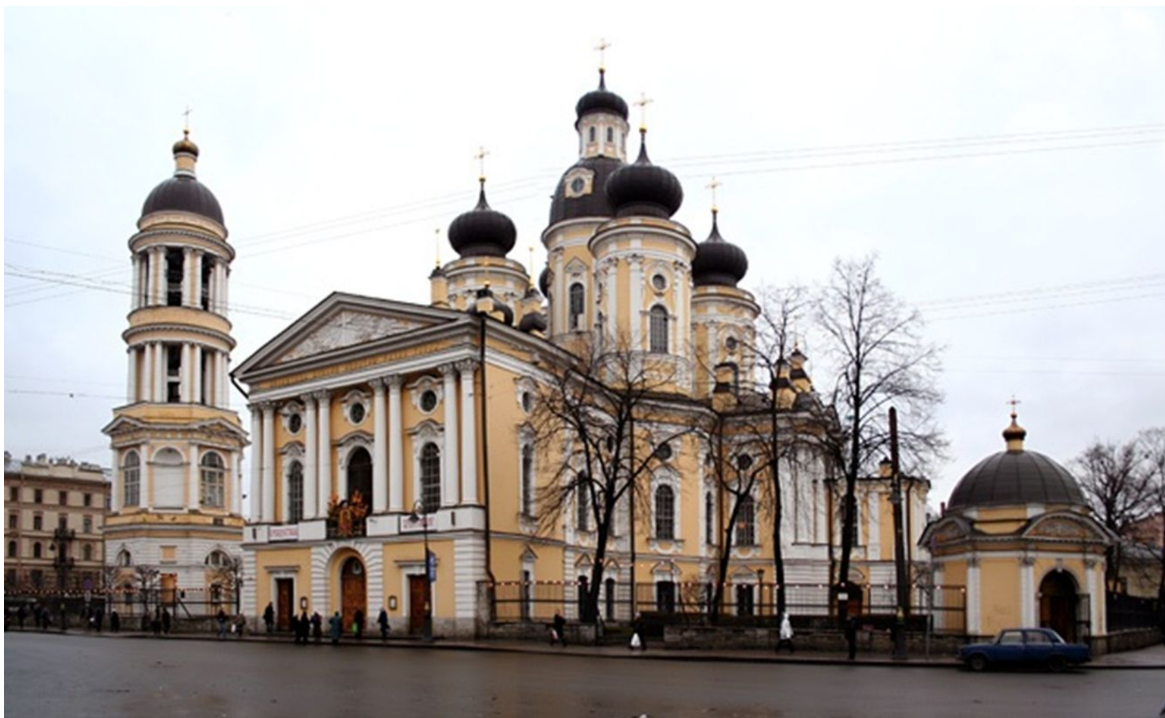
Собор Владимирской иконы Божией Матери с колокольней