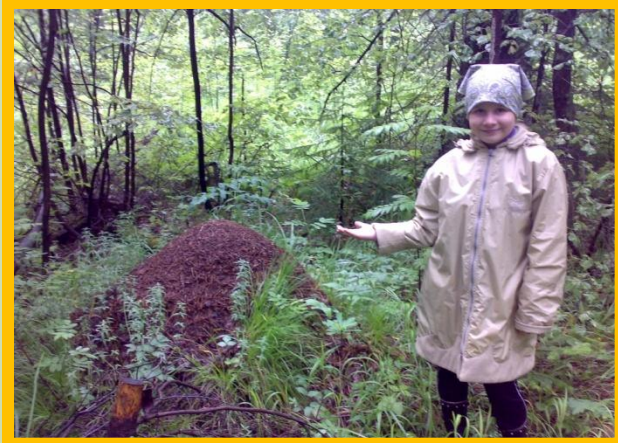
• Лесные полянки