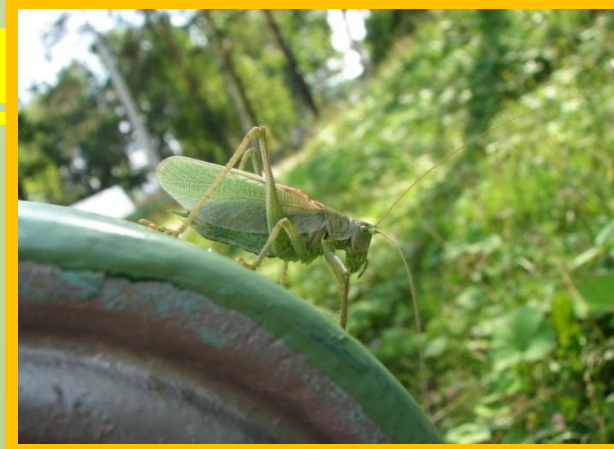
• Городские газоны