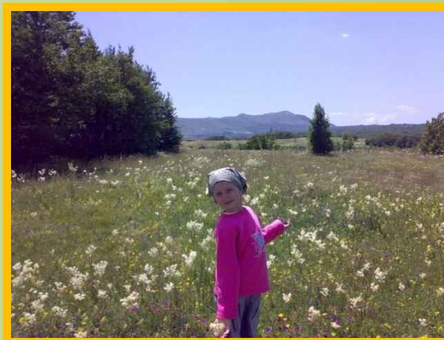
• Поля и луга