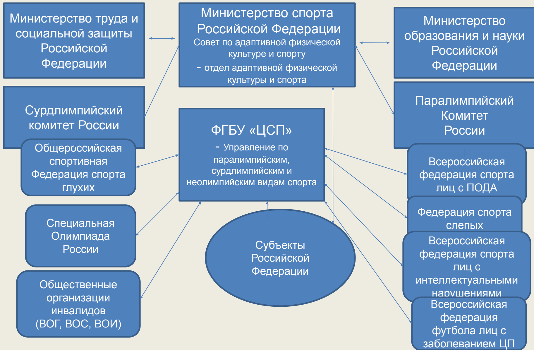
Структура управления адаптивной физической культурой и спортом в Российской Федерации