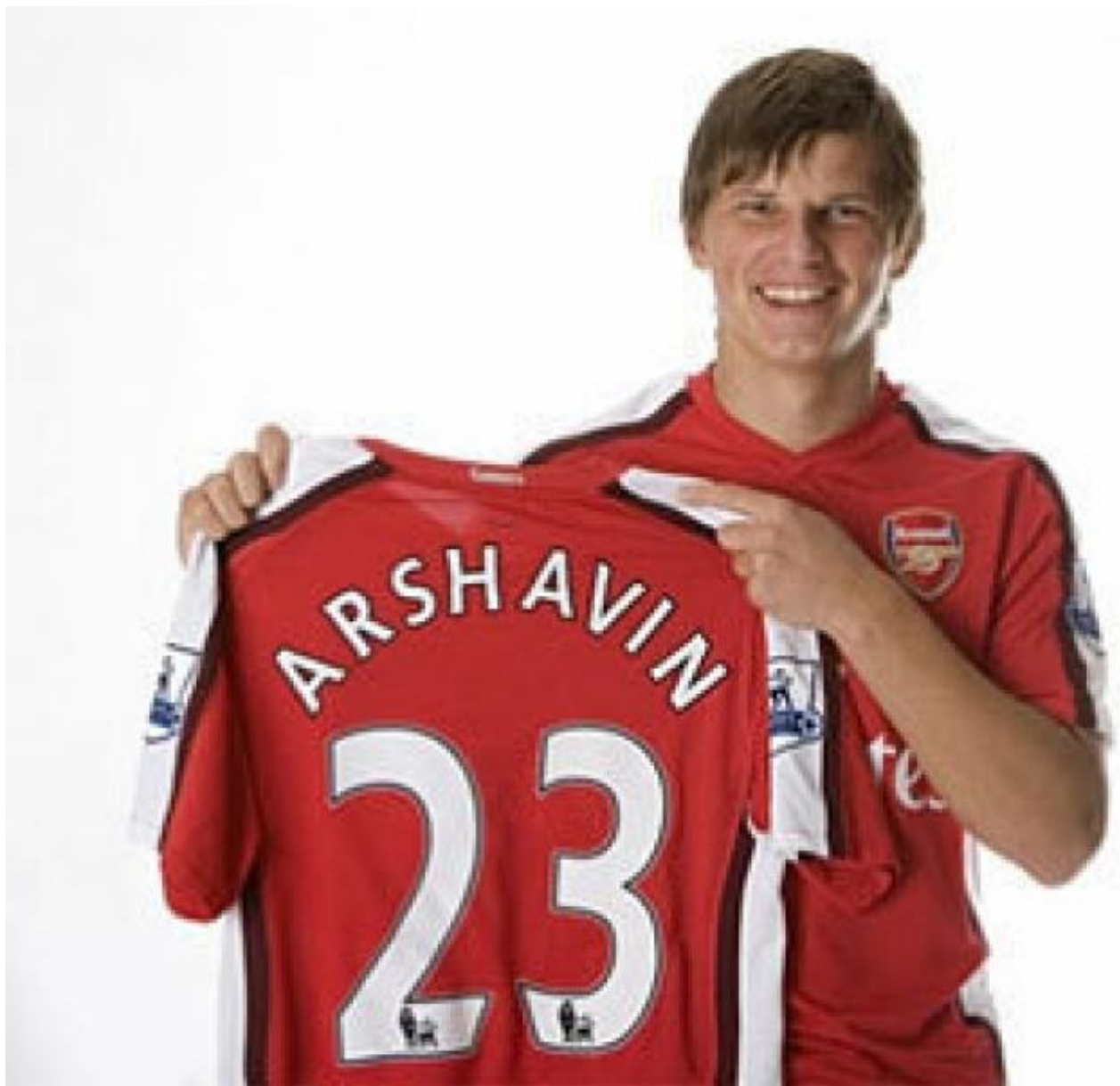
Российский футболист Андрей Аршавин