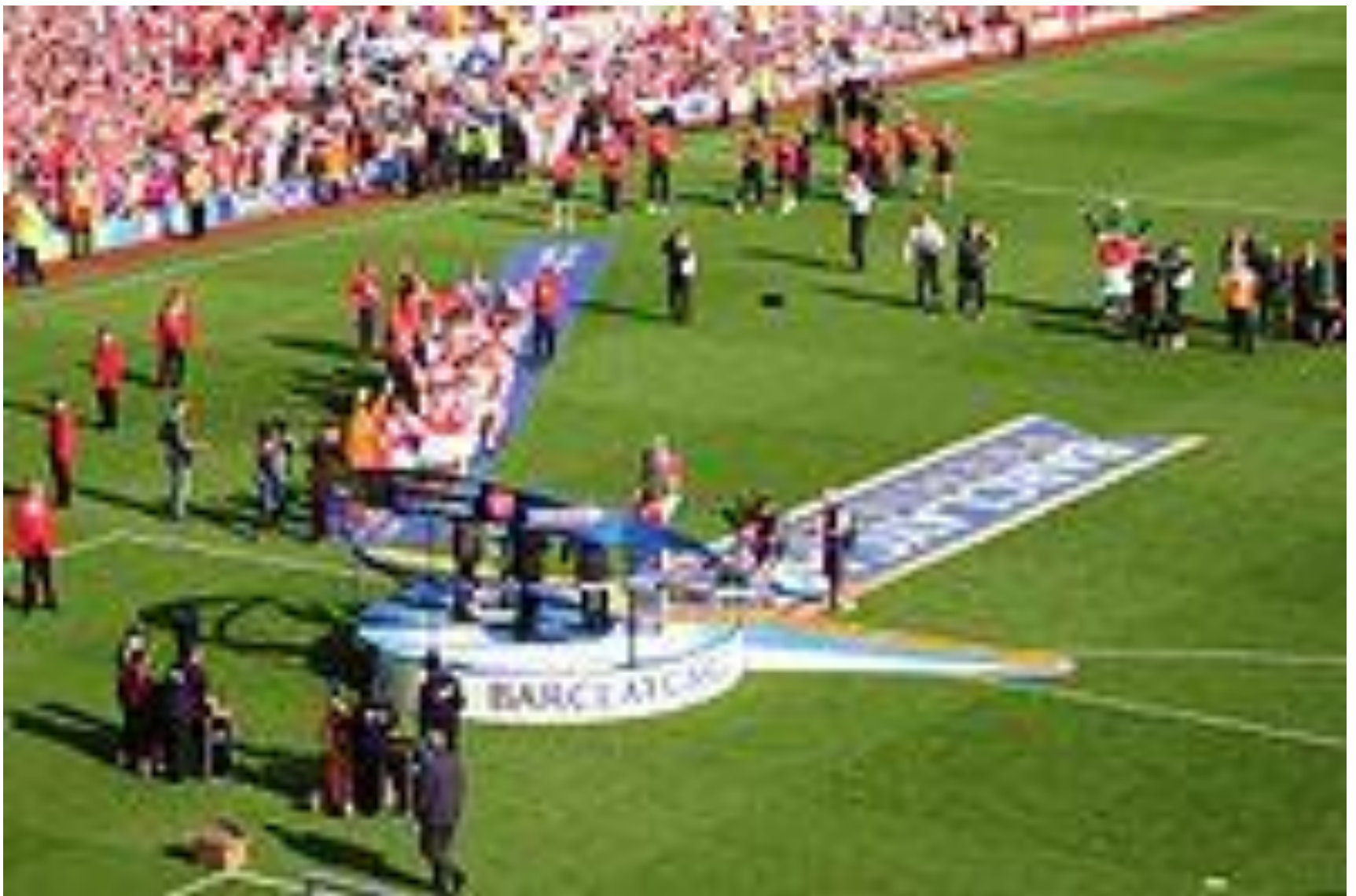
Капитан «Арсенала» Патрик Виейра поднимает кубок чемпионата английской Премьер-лиги 2003/04 г.