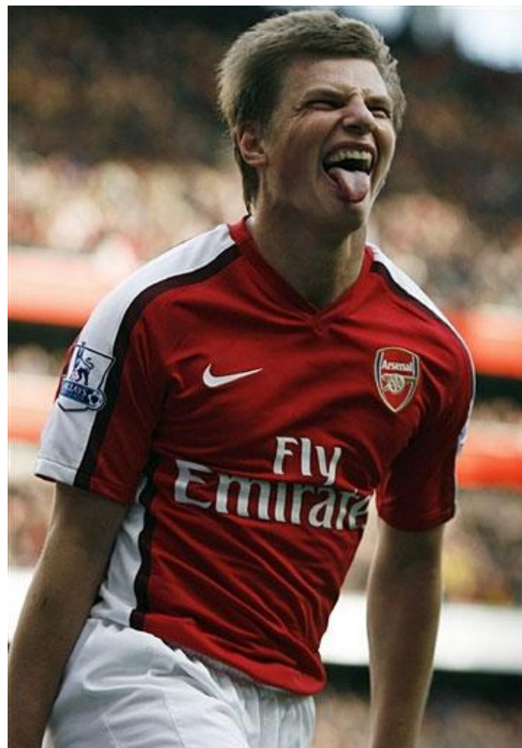
Российский футболист Андрей Аршавин в составе команды «Арсенал»