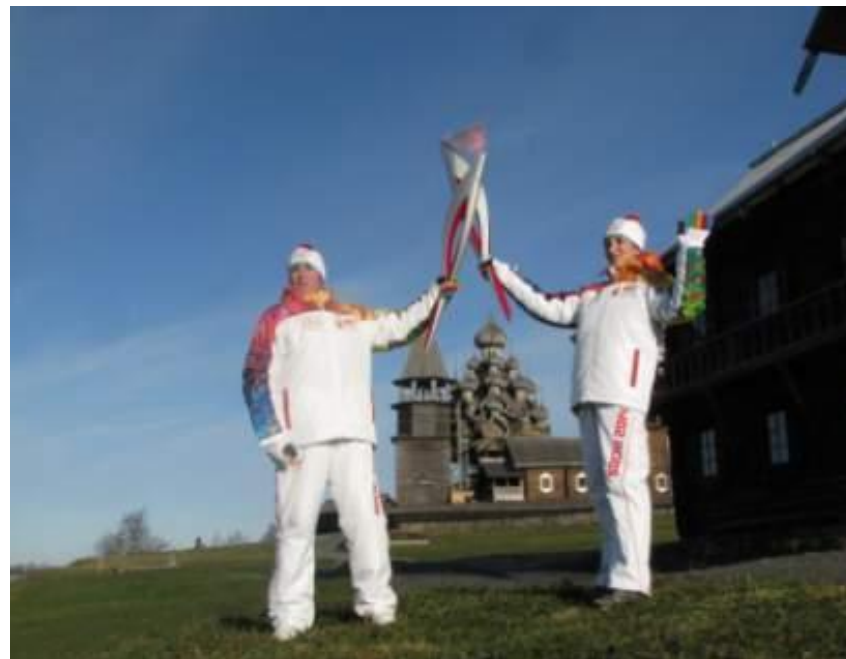
Остров Кизи, Онежское озеро