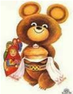
Москва - 80