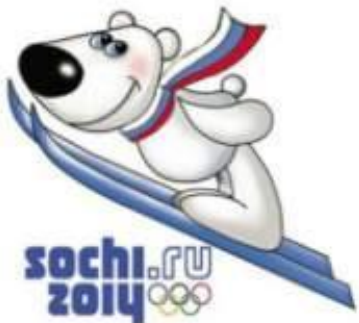
Сочи - 2014