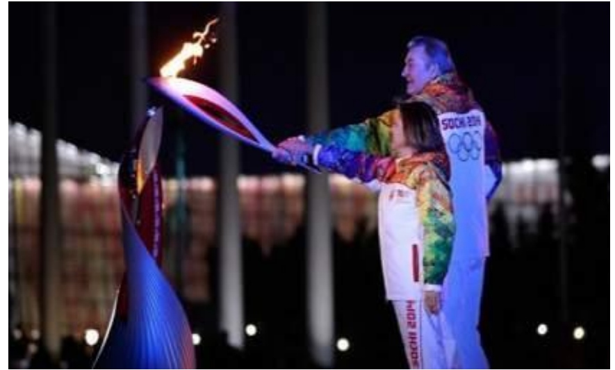
Ирина Роднина , Владислав Третьяк

Эстафета идёт круглосуточно при любых метеорологических условиях, от Олимпийского огня зажигаются запасные — в специальных защитных лампах (типа шахтёрских). Если маршрут эстафеты проходит через горные массивы, водоёмы и т. п., используются различные виды транспорта, средства космической связи. Обычно честь завершить эстафету (последний этап — по дорожке олимпийского стадиона) и зажечь эстафетным факелом олимпийский огонь в специальной чаше предоставляется НОК одному из лучших спортсменов своей страны.