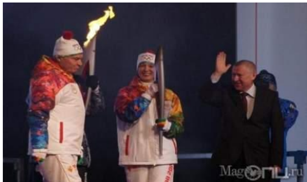
Этапы эстафеты в Магнитке: через комбинат, на коне