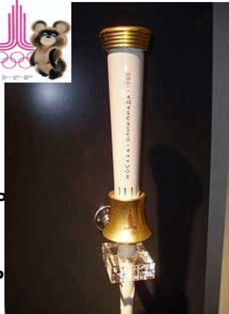
Факел эстафеты олимпийского огня Московской Олимпиады