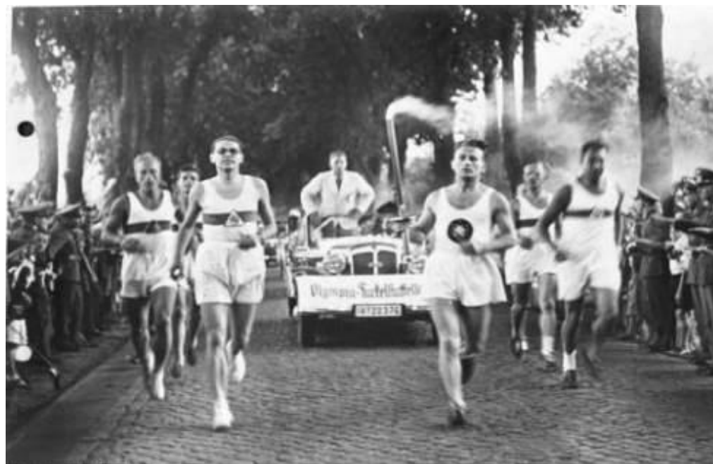
См. также: 012 146-1019-110-02A Foto: a. Aug. 1 1936