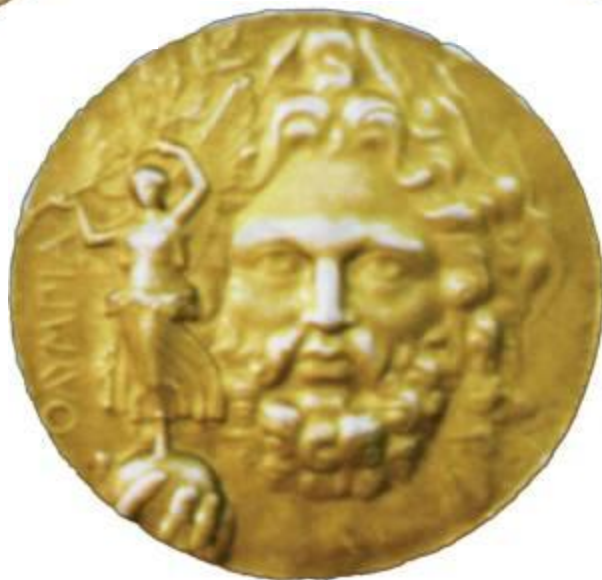
⦿ Медали 1906 года