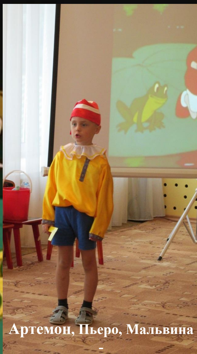
Артемон, Пьеро, Мальвина

Дружат все они со мной, Всюду нос сую я длинный, Моё имя . . .